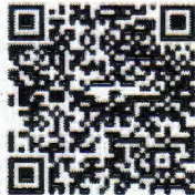
แบบประเมิน